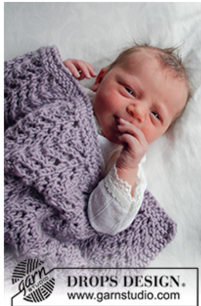
DROPS Baby 33-40

Pinde nr er kun vejledende. Får du for mange masker på 10 cm, skift til tykkere pinde. Får du for få masker på 10 cm, skift til tyndere pinde.